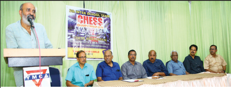
ഇന്റർ സ്കൂൾ ചെസ്സ് ജില്ലാ ടൂർണമെന്റ് അഡ്വ. മാത്യു ടി. തോമസ് എം.എൽ.എ. ഉദ്ഘാടനം ചെയ്യുന്നു