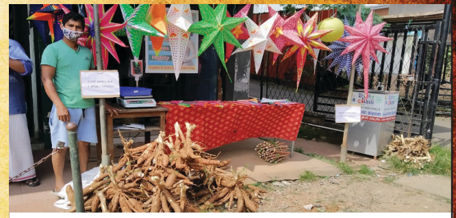
ക്രിസ്മസ് സ്റ്റോളും വികാസ് സ്കൂളിൽ ഉദ്ഘാടനം ചെയ്യുന്നു