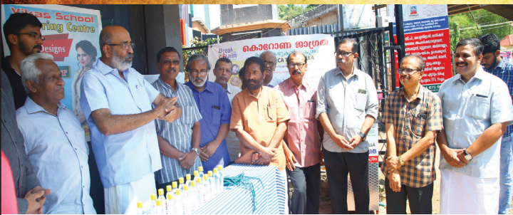
ബ്രേക്ക് ദി ചെയ്ൻ കോവിഡ് പ്രതിരോധത്തിന്റെ ഭാഗമായി ആരംഭിച്ച കൈകഴുകൽ കേന്ദ്രം അഡ്വ. മാത്യു ടി. തോമസ് എം.എൽ.എ. ഉദ്ഘാടനം ചെയ്യുന്നു