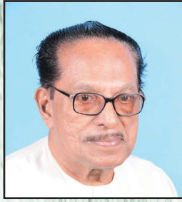
എബ്രഹാം പാലത്തിങ്കൽ, മുൻ പ്രസിഡന്റ്